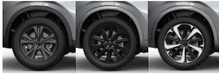
Gris Metalizado Negro Metalizado Bitono (Negro/Gris Metalizado)